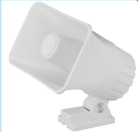
SIRENA HAGROY ES200R – Sirena Doble Tono 12VDC 30W

Sirena Hagroy ES200R de 30W y 110 dB, doble tono y 12VDC. Ideal para sistemas de alarmas, viviendas y comercios. Potente, eficiente y fácil de instalar.