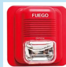
SIRENA CON LUZ ESTROBO DE 3 SONIDOS | DIMAX

Sirena con estrobo rojo OPALUX GL-14N, ideal para sistemas de contra incendio y seguridad. Cuenta con 3 tonos de alarma, \geq 90 dB, luz estroboscópica LED y compatibilidad universal. Eficiente, durable y diseñada para entornos industriales y comerciales.