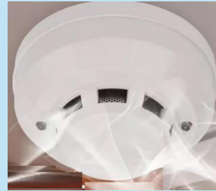
Detector de humo convencional 2-4 hilos 12-24V | Dimax

Es un sensor de humo fotoeléctrico diseñado para sistemas centralizados de detección de incendios en hogares, oficinas, comercios, almacenes, industrias y edificaciones exigidas por INDECI.