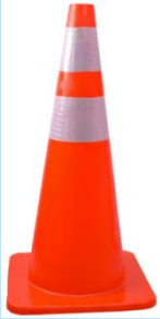
CONO DE SEGURIDAD DE PVC NARANJA 36" – Doble cinta reflectiva

Cono de seguridad de PVC de 36" con doble cinta reflectiva, base de goma y alta resistencia UV. Ideal para señalización vial, obras y zonas de riesgo. Durable, estable y de máxima visibilidad.