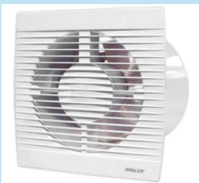
EXTRACTOR DE AIRE 4" OPALUX OP-B4

Iluminación automática y seguridad contra robo, con detección hasta 6 m, ajustes de sensibilidad y retardo, compatible con lámparas incandescentes y LED. Ideal para montaje en techo y control eficiente de espacios.