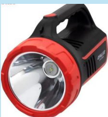
LINTERNA LED RECARGABLE OPALUX OP-8795R

Ofrece potencia y resistencia en un diseño portátil de 5W. Ideal para el hogar, talleres o emergencias.