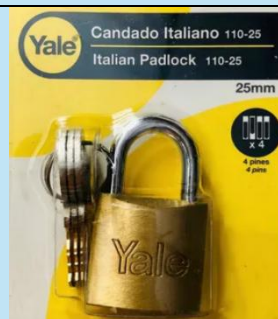
Candado Yale Serie Y110 – 25 mm

Incluye 3 llaves y garantía de por vida. Ideal para ferretería y alta seguridad.