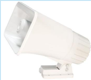
SIRENA OPALUX 220 VAC 90W – Modelo OP-90S

La Sirena OP-58S de Opalux ofrece 60W de potencia y 125 dB, dos tonos de emergencia y funcionamiento en 12-24 VDC. Ideal para alarmas y vehículos de seguridad. Durable, potente y lista para condiciones exigentes.