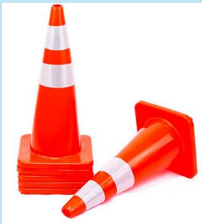
CONO DE SEGURIDAD PVC COLOR NARANJA C/2 CINTAS REFLECTIVAS DE 2" – 28"

Resistente, estable y altamente visible. Ideal para obras, vías públicas y zonas industriales.