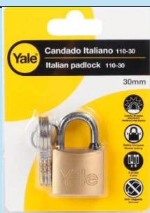
Candado Yale Serie Y110 – 30 mm

Incluye 3 llaves y garantía de por vida. Ideal para ferretería y alta seguridad.