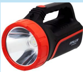
LINTERNA LED RECARGABLE 3W OPALUX OP-8693R

Es tu aliada ideal para el hogar, camping o emergencias. Ofrece iluminación confiable y prolongada con carga rápida tipo C.