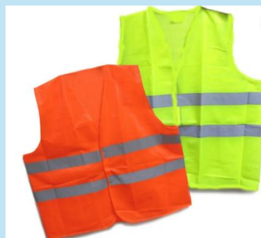
CHALECOS DOS BANDAS ANARANJADO | VERDE LIMÓN – Poliéster Alta Visibilidad

Chaleco reportero de alta visibilidad en poliéster anaranjado, con 6 cintas reflectivas, bolsillos funcionales y cierre resistente. Ideal para construcción, minería, transporte y vigilancia.