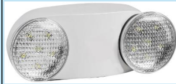
LUZ DE EMERGENCIA LED OPALUX OP-9709UL

Es una solución confiable y eficiente diseñada para garantizar iluminación inmediata en situaciones de corte eléctrico.