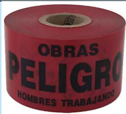
Cinta de Seguridad de Señalización Rojo 200 m

Es un elemento esencial para la delimitación y señalización de zonas de riesgo en obras civiles, mantenimiento industrial, construcción, seguridad vial y servicios municipales.