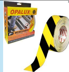
Cinta Antideslizante Negro Amarillo Opalux AN-18N-A

Alta visibilidad, adhesivo resistente y excelente durabilidad en ambientes industriales.