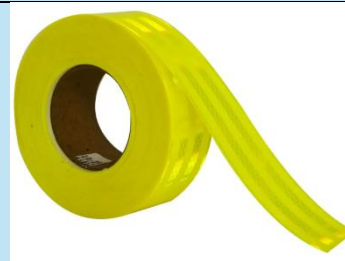
Cinta Reflectiva Vehicular Grado Diamante AMARILLA

Es un elemento esencial para la delimitación y señalización de zonas de riesgo en obras civiles, mantenimiento industrial, construcción, seguridad vial y servicios municipales.