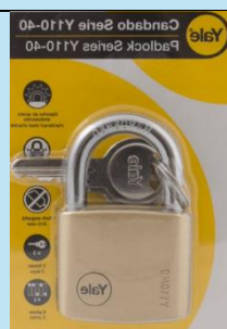
Candado Yale Serie Y110 – 40 mm

Incluye 3 llaves y garantía de por vida. Ideal para ferretería y alta seguridad.