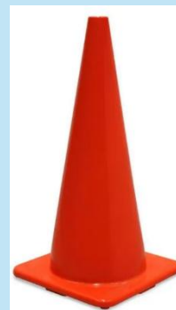
Cono de seguridad Naranja 28" – Artículos de Seguridad Vial

Cono de seguridad de PVC de 28", color naranja con 2 cintas reflectivas de 2". Alta visibilidad, resistente y perfecto para señalización vial e industrial.