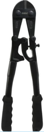
CIZALLA PARA CORTAR 24" NEGRO KM-033

Con cuerpo y cuchilla de acero forjado, mangos antiderrapantes y sistema de palanca de triple apoyo para cortes potentes y precisos. Ideal para trabajos profesionales de ferretería y construcción.