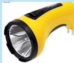
LINTERNA LED RECARGABLE OP- 4251A | OPALUX

Resistente a impactos y con dos modos de iluminación: alta y ahorro. Ofrece hasta 14 horas de autonomía y 100 metros de alcance, ideal para uso doméstico o profesional.