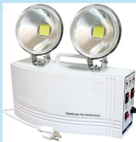
LUZ DE EMERGENCIA OPALUX 9808UL

Está diseñada para garantizar iluminación inmediata y segura ante cortes eléctricos en espacios comerciales, industriales o residenciales.