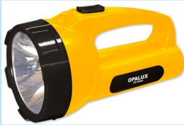
LINTERNA LED 5W RECARGABLE | OP-8295A

Ideal como luz de emergencia y para trabajos en talleres, obras y uso doméstico. Cuenta con batería de 4V 1600 mAh, dos niveles de iluminación, hasta 4 horas de autonomía, indicador LED de carga y luz blanca fría de alta potencia.