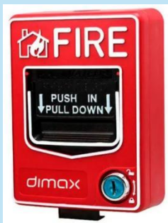
ESTACIÓN MANUAL DOBLE ACCIÓN OPALUX PUL-6C

Detector de humo fotoeléctrico diseñado para brindar detección temprana de incendios en oficinas, almacenes, comercios, viviendas, centros educativos, hospitales y plantas industriales.