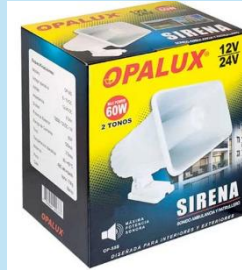
Sirena OP-58S – Sirena 12-24 VDC de 60W | Opalux

Sirena Hagroy ES200R de 30W y 110 dB, doble tono y 12VDC. Ideal para sistemas de alarmas, viviendas y comercios. Potente, eficiente y fácil de instalar.