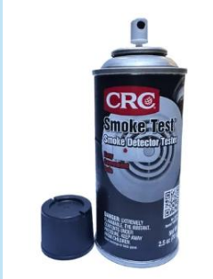
CRC Smoke Detector Tester 2.5 oz.

Es un aerosol profesional para probar sensores de humo sin escaleras, seguro, portátil y eficiente para mantenimiento residencial y comercial.