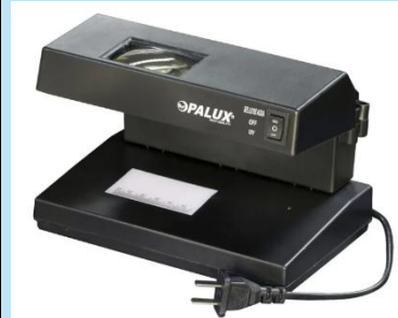
Detector de Billetes Falsos con Lupa 9W OPALUX OP-2138

Es un aerosol profesional para probar sensores de humo sin escaleras, seguro, portátil y eficiente para mantenimiento residencial y comercial.