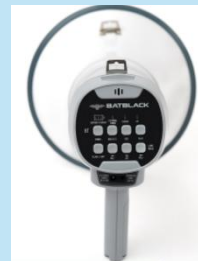
MEGÁFONO 120W RECARGABLE CON USB - BLUETOOTH BATBLACK BT-MF120

Estación manual convencional Dimax W031 de doble acción, fabricada en policarbonato, compatible con todos los paneles contra incendio.