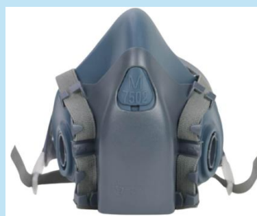
RESPIRADOR DE SILICONA CON CARTUCHO 6003

Guantes anticorte de alto rendimiento con resistencia nivel 5, palma recubierta con PU triple baño y gran agarre para trabajos industriales donde se requiere seguridad y precisión.