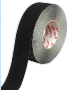
Cinta Antideslizante Negro Opalux AN-18N

Mejora la seguridad en zonas de alto tránsito con esta cinta antideslizante profesional, ideal para prevenir deslizamientos en superficies lisas.