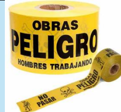
Cinta de Seguridad de Señalización Amarillo 200 m

Ofrece alta tracción, gran durabilidad y excelente adhesión para prevenir deslizamientos en escaleras, rampas y áreas de trabajo.