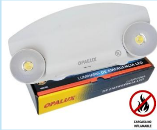
LUZ DE EMERGENCIA LED OPALUX 9303UL

Es una solución confiable y eficiente diseñada para garantizar iluminación inmediata en situaciones de corte eléctrico.