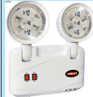
LUZ DE EMERGENCIA OPALUX 9101-220 LED SLIM

Está diseñada para proporcionar una fuente de iluminación segura y eficiente en situaciones de corte de energía eléctrica.