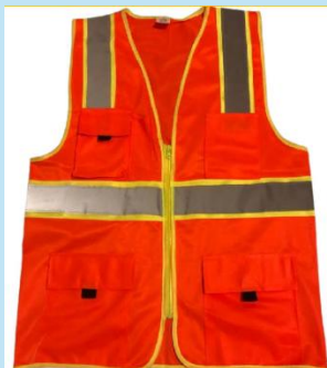
CHALECO REPORTERO DE POLIÉSTER ANARANJADO – ALTA VISIBILIDAD

Chaleco reportero de alta visibilidad en poliéster anaranjado, con 6 cintas reflectivas, bolsillos funcionales y cierre resistente. Ideal para construcción, minería, transporte y vigilancia.