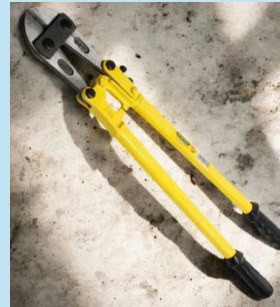
CIZALLA PARA CORTAR ALAMBRE 24" KAMASA – HERRAMIENTA PROFESIONAL DE ALTO DESEMPEÑO

Con cuerpo y cuchilla de acero forjado, mangos antiderrapantes y sistema de palanca de triple apoyo para cortes potentes y precisos. Ideal para trabajos profesionales de ferretería y construcción.