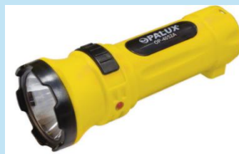
LINTERNA RECARGABLE 1 LED 1W | OP- 4052A

Ilumina cualquier espacio con la linterna LED recargable OPALUX OP-8795R de 5W. Potente, práctica y duradera, ofrece hasta 20 horas de autonomía y 100 m de alcance.