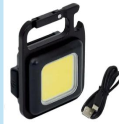
LINTERNA LED MULTIFUNCIONAL OPALUX OP-5915 | RECARGABLE 1W |100LM

Ideal como luz de emergencia y para trabajos en talleres, obras y uso doméstico. Cuenta con batería de 4V 1600 mAh, dos niveles de iluminación, hasta 4 horas de autonomía, indicador LED de carga y luz blanca fría de alta potencia.