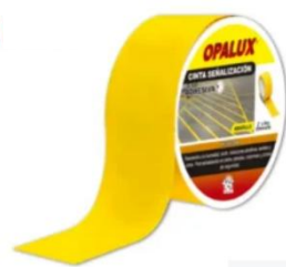
Cinta Antideslizante Amarillo Opalux AN- 18-A

Alta visibilidad, adhesivo resistente y excelente durabilidad en ambientes industriales.