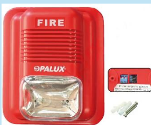
SIRENA CON ESTROBO ROJO OPALUX GL-14N

Megáfono BT-MF120 BATBLACK de 120W, alcance de 800 m, autonomía de 6 h y conectividad USB/Bluetooth/MicroSD. Ideal para perifoneo, eventos y seguridad.