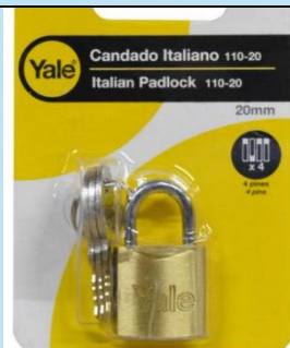
Candado Yale Serie Y110 – 20 mm

Candado Yale Y110 de 20 mm, fabricado en latón endurecido con gancho de acero templado. Ideal para asegurar herramientas, bicicletas, puertas y equipos con máxima resistencia y durabilidad.