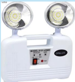
LUZ DE EMERGENCIA OPALUX 9101- 4SMD | 48 LEDS 4H

Es un sistema de iluminación de respaldo diseñado para garantizar seguridad y visibilidad en caso de cortes eléctricos.