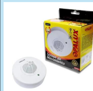
SENSOR DE MOVIMIENTO 220VAC 360° OPALUX ST- 06A

Ideal para negocios que buscan seguridad y verificación rápida de billetes nacionales e internacionales.