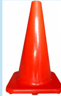
CONO DE SEGURIDAD DE PVC NARANJA 36" – 90 CM

Cono de seguridad de PVC de 36" con doble cinta reflectiva, base de goma y alta resistencia UV. Ideal para señalización vial, obras y zonas de riesgo. Durable, estable y de máxima visibilidad.