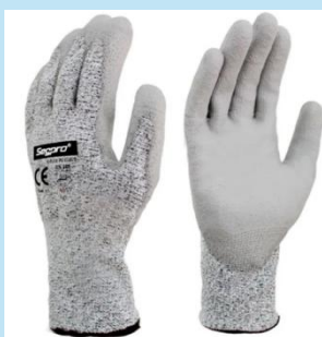
GUANTES ANTICORTE G-FLEX PU CUT5 | SEGPRO

Chaleco reflectivo de alta visibilidad en poliéster (naranja o verde limón) con dos bandas reflectivas y cierre velcro.