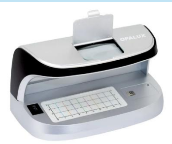
Detector de Billetes Falsos Recargable OP-2111 | OPALUX

Ideal para cajas y comercios que requieren máxima seguridad y confiabilidad en la detección de falsificaciones.