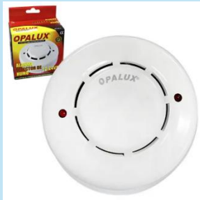
Alarma Detector de Humo - ST-85-2 | Opalux

Es un sensor de humo fotoeléctrico diseñado para sistemas centralizados de detección de incendios en hogares, oficinas, comercios, almacenes, industrias y edificaciones exigidas por INDECI.